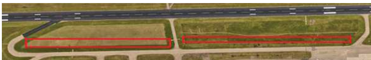
Abbildung 1: Grünflächen zwischen Rollbahn C und D sowie D und E

Grünflächen (rot markiert) zwischen Rollbahn C und D sowie D und E (von den Rollhalteorten Richtung Rollbahn N):