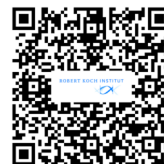
Weitere Informationen RKI