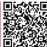
Weitere Informationen BZgA