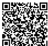
*Quarantäne bei Einreisen nach Deutschland

** www.bundesregierung.de/breg-de/themen/coronavirus/corona-bundeslaender-1745198